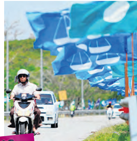
RISALAH dan perang poster menjelang PRU-13.

Naik turun dalam politik adalah perkara biasa. Dipilih, dipilih semula atau tidak dipilih sebagai calon PRU sudah menjadi lumrah. Terimalah hakikat ini. Kita sering mendengar pemimpin di peringkat baha-