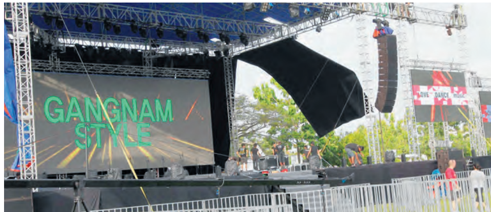
PENTAS utama bagi persembahan artis PSY di Pulau Pinang hari ini.

Selak kembali tarian ala K-Pop di Kepala Batas, Pulau Pinang tahun lalu. Majlis yang